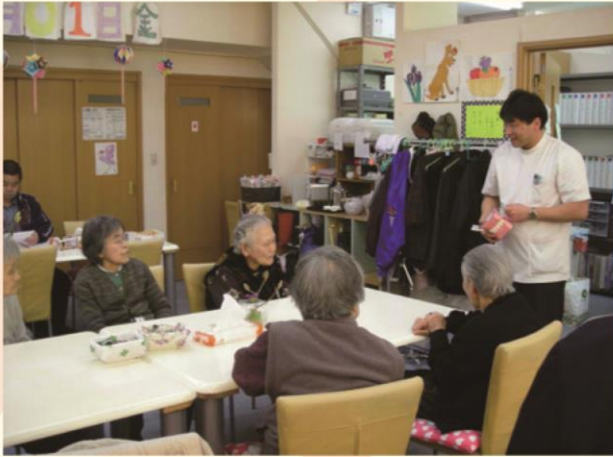
利用者様向けの講習会