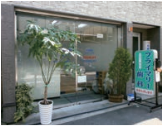
外来診療も行っております 車いすで診療室まで、そのまま入れます