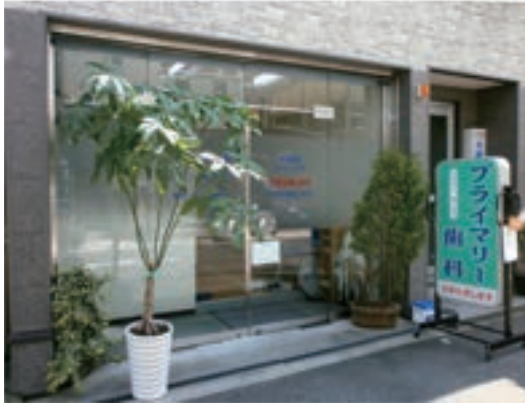
外来診療も行っております 車いすで診療室まで、そのまま入れます