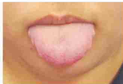
歯の側面に凹凸ができています