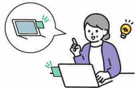
付箋に気がいたら口を開く

テレビやパソコンなど、よく目につくところに「歯を離す」と書いた付箋を貼ります。付箋を見て噛みしめに気がいたら、歯を離す習慣をつけましょう。